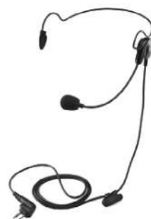
53815 – Fone de cabeça leve com microfone boom