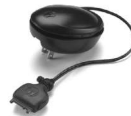
53969 – Fonte de alimentação para carga rápida de 1 hora