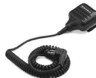
HMN9026 – Microfone com alto falante remoto