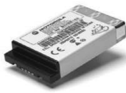
53963 – Bateria Li-ion de capacidade padrão