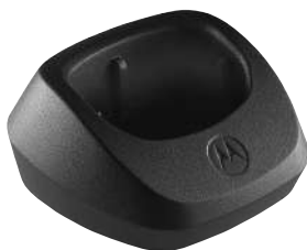
53962 – Base da bandeja do carregador