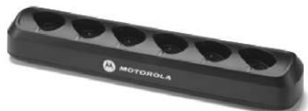
53960 – Carregador múltiplo para 6 rádios