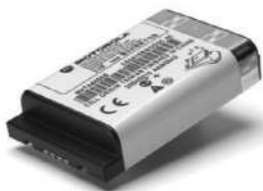
53964 – Bateria Li-ion de alta capacidade