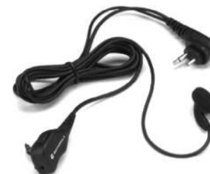
HMN8435 – Fone de ouvido e microfone com clipe e botão push-to-talk (PTT)