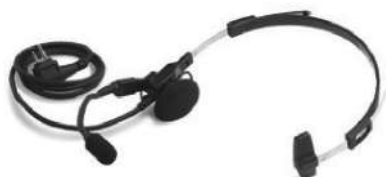
BDN6773 – Fone de cabeça com microfone boom giratório