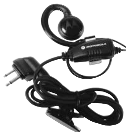
RLN6423 – Fones de ouvido giratórios