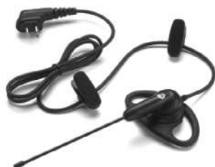
56518 – Fone de ouvido estilo D com microfone boom